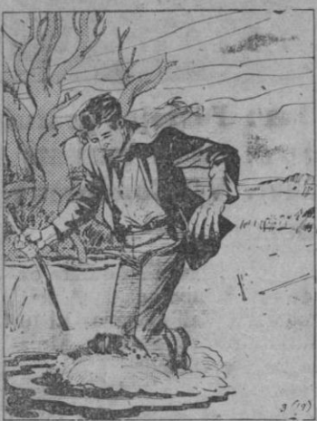
LIBERTAD.—Caminando con dificultad, abandonó el hospital y supo que la Policía secreta le buscaba. Huyó de Budapest, y anduvo los noventa kilómetros que le separaban de la frontera húngara con las piernas casi inútiles. Los soldados rojos dispararon contra él cuando vadeaba el agua helada, pero pudo escapar, más muerto que vivo.