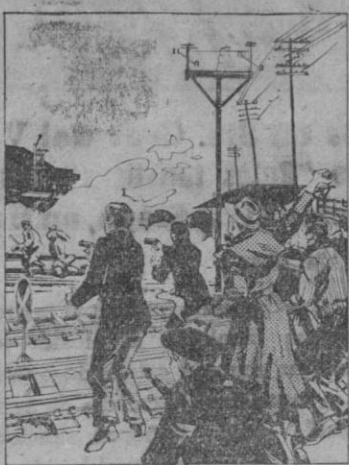
VALOR.—Al estallar la revuelta, Aurel y varios de sus compañeros atacaron y tomaron las estaciones de radio y del ferrocarril de Talabanya. A continuación marcharon en un camión a Budapest, donde se unieron a los que luchaban en la ciudad contra los rojos. La pierna sana de Aurel fue alcanzada por un disparo de cañón y le enviaron al hospital.