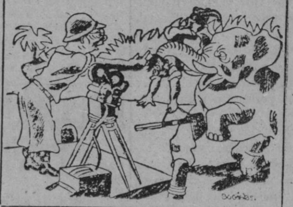
El operador (al elefante).—¡No, hombre, no!... No te crispes de ese modo; más naturalidad.

Francoís Mauric, Premio Nobel de Literatura, pasando una tarde por la orilla del Sena, en París, halló en uno de los puestos de libros un ejemplar de una de sus obras. Examinó el volumen y vió en la página una dedicatoria muy afectuosa que él mismo había escrito de su puño y letra a un amigo de la infancia. —¿Le interesa?—le preguntó el librero.—Vale trescientos francos; pero como ha habido un imbécil que ha escrito una tontería en una hoja, se lo dejaré a usted en doscientos francos.