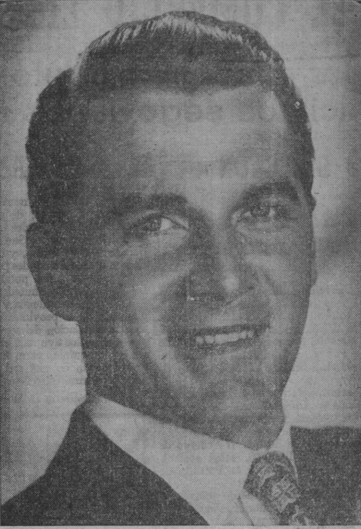
William Forrest Andrews conocido en Steve Forrest para la pantalla, es hermano de Dana Andrews y empezó a abrirse paso en el mundo del espectáculo trabajando de ayudante de carpintero en el teatro de aficionados de La Jolla, California. Gregory Peck le conoció allí y fue quien le lanzó a las tablas encomendándole un papel secundario. Una de sus últimas interpretaciones es en "The Living Idol", de M-G-M.