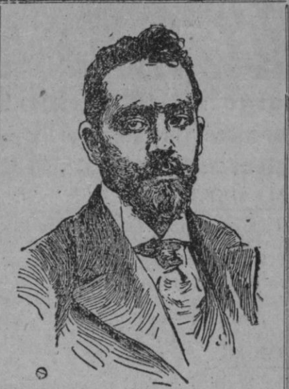
ANICETO MARINAS (Grabado de 1914.).

Pero esto era preciso para obsequiarle y tienes a la fuerza que resignarte, porque en el mundo el genio que brillar quiere, cuando a subir empieza de hambre se muere, y cuando llega y todo le importa un bledo... ¡le dan cada banquete que mete miedo! Yo que de noche, apenas compro el «Heraldo», voy a tomar a casa mi sopicaldo, a impulsos del afecto que te profeso también aquí, como otros, hogo un exceso; y como al fin se trata de agasajarte y cualquier sacrificio debo brindarte, te brindo, y te la brindo de buena gana, la dispespsia que acaso tendré mañana. Los genios cuando tienen ya nombre y gloria no gozan los dulzuras de la victoria y cual los monumentos de aquí, ruinosos, tienen varias goteras y son famosos. También yo, tras de afanes y de quimeras, soy genio... pero sólo por las «goteras»... ¡Cómo hemos, Aniceto, de hallar la vida, aunque no somos viejos, muy divertida, si hasta el vino que ahuyenta penas y males lo bebemos con aguas medicinales!... En fin, ahí va mi aplauso, Marinas; y ahora, como han dicho, y a todos nos es muy grato, que lleven esas flores a tu señora ¡y para ti que traigan bicarbonato!