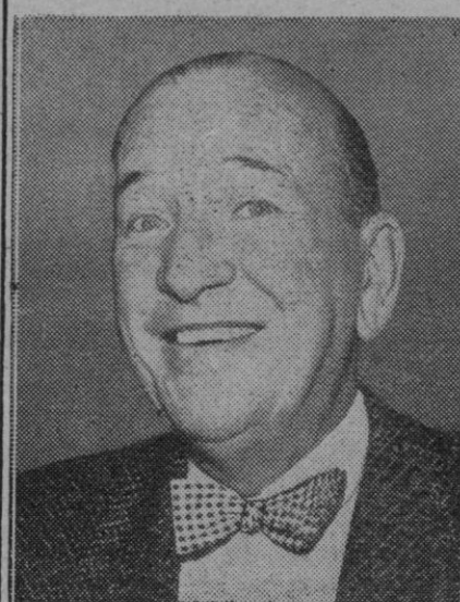
Noël Coward, escritor y autor dramático inglés que para huir de los impuestos ha marchado a Jamaica. Está acusado de un delito, en este sentido, por veinticinco millones de francos