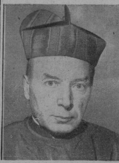
El cardenal Wyszyński, primado polaco, quien ha visitado recientemente a Su Santidad el Papa

El S. Nacional del Trigo pagará por Qm. 504, 496 y 486 pesetas según tipos