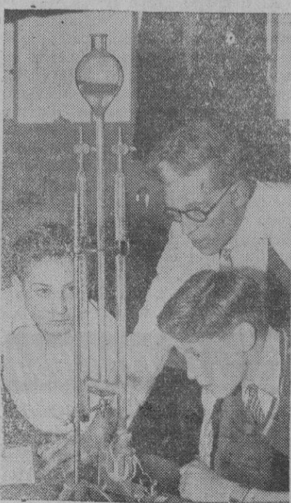
Dos muchachos británicos realizan un experimento de electrolisis del agua bajo la vigilancia de su profesor de ciencias, en un moderno laboratorio de la nueva escuela secundaria de St. Michaels, del sudeste de Londres