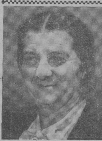
La señora Golda Meyerson, nuevo ministro israelita de Negocios Extranjeros

Centenares de miles de cartas se depositan cada año en Correos con las señas equivocadas e incluso sin señas. Poniendo al reverso de los envíos el nombre y dirección del remitente, si aquéllos no pueden entregarse al destinatario se devuelven a quien los envió.