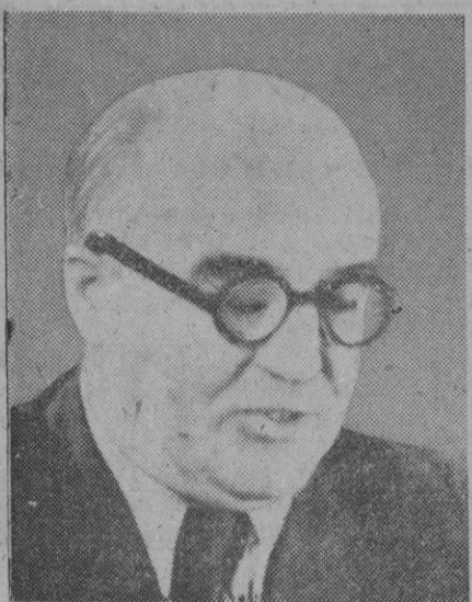
Harry Pollitt, jefe del partido comunista británico, que está siendo muy criticado por sus colegas por su fidelidad a Stalin, en estos momentos en que todo son críticas a la política del fallecido dictador rojo

El alcalde, marqués de Contadero, ha dirigido con este motivo una alocución al pueblo sevillano