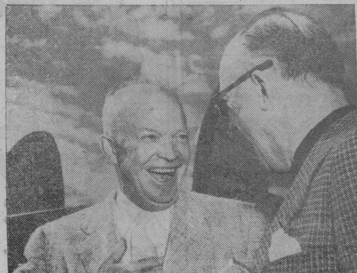
Uno de los principales consejeros del Presidente de los Estados Unidos, Dwight D. Eisenhower, es su hermano Milton, presidente de la Universidad de Pennsylvania. Antes de la guerra mundial, el nombre de Milton era mucho más conocido en Norteamérica que el de "Ike". Sin embargo, ahora Dwight es el más famoso, y una de las personas que más le apoyan y más estrechamente colaboran con él en sus esfuerzos para mantener y asegurar la paz mundial es Milton. En la fotografía los dos hermanos charlan animadamente.