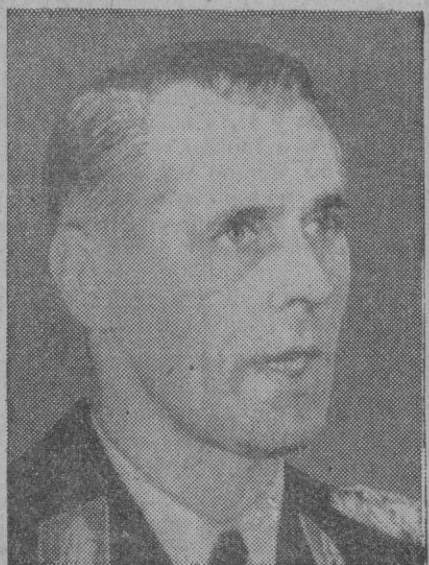
Willy Stoph, hasta ahora ministro del Interior en la Alemania Oriental que ha sido nombrado recientemente ministro de Defensa