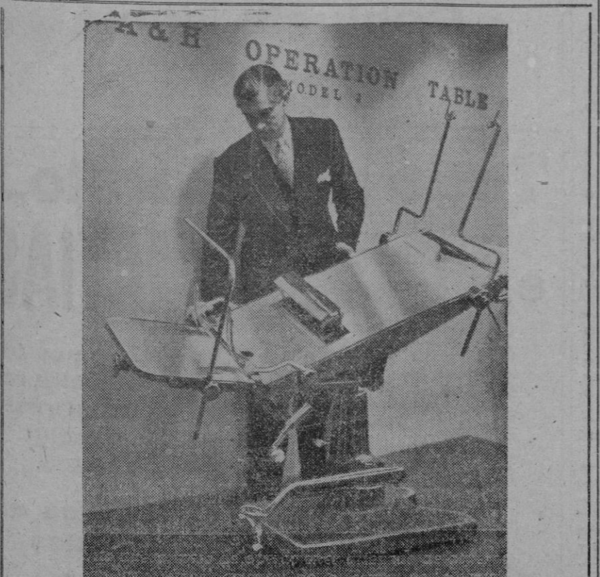
Una nueva mesa de operaciones diseñada de acuerdo con los últimos adelantos de la técnica de la cirugía