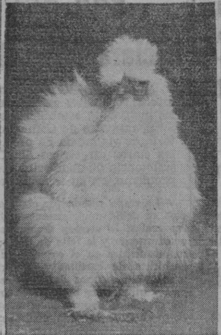
Polliña blanca "Silkie", que obtuvo el primer premio de su clase en la Exposición Avícola inglesa. Esta raza, de origen asiático, tiene pelusa en lugar de plumas

Muy firmes están los precios del maíz en Valencia, donde por quedar poca mercancía en poder de los productores, éstos no la ceden en el campo si no se la pagan a 2,85-2,90 pesetas kilo, sin envases, más gastos.