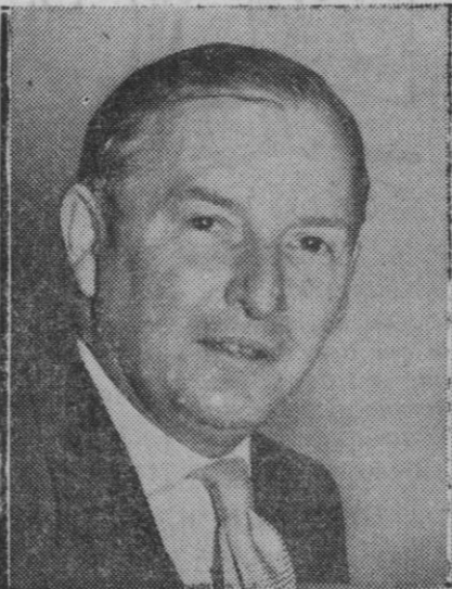
Selwyn Lloyd, antiguo ministro de Defensa Nacional en Gran Bretaña, que acaba de ser nombrado ministro de Negocios Extranjeros

palabras de afecto para España y para Barcelona con una bendición para los asistentes.