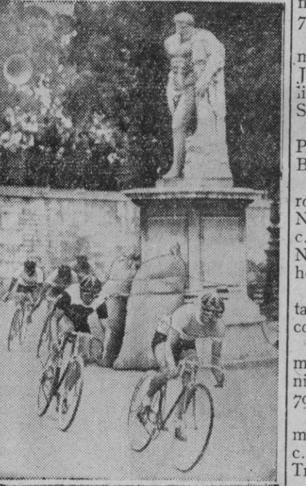
Estos ciclistas franceses participan en una prueba de tantas como se celebran en todo el mundo. Pero aquí la estampa tiene un cierto aire gracioso. Por lo menos Hércules, desde su estatua retrá un tanto maliciosamente el paso de los ciclistas