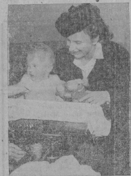
Al niño hay que pesarle desde que nace y con frecuencia para vigilar lo que da de sí en su desarrollo. Pero no se preocupe; pesándole y todo el pequeño no desarrollará más de lo debido. Y menos mal si a pesar de todos esos cuidados, el niño no sólo no prospera, sino que va de mal en peor