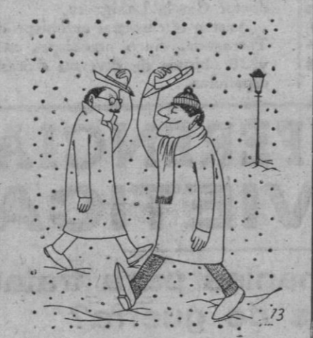
Saludo para invierno.

HORIZONTALES: 1. Rot. Alo.—2. Orel. Amor.—3. Mía. Onega.—4. Al Ocal.—5. Las. Dal.—6. Aré. Eso.—7. areS. Ra.—8. Cabal. seG.—9. Amés. Rita.—10. Más. loR. VERTICALES: 1. Roma. Cam.—2. Orilla. Ama.—3. Tea. Arabes.—4. Ose. ras.—5. Oc. El.—6. Anades.—7. Amé. las. Sil.—8. loG. Loreto.—9. Ora. Agar.