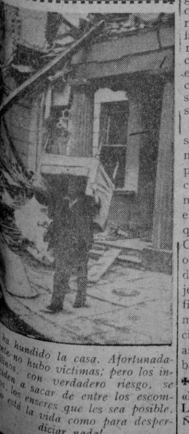
Una hondonada de la casa. Afortunadamente no hubo víctimas; pero los incendios, con verdadero riesgo, se intentó sacar de entre los escombros, los enseres que les sea posible. Así está la vida como para desahuciar nada!

Madrid, 3.—Un frente frío ha penetrado por Galicia, dando lugar a lluvias. En ese región se produjeron algunos chubascos débiles a la cuneta media del Ebro. Predice el Observatorio Meteorológico que el frente se trasladará hacia el sureste, produciendo chubascos de lluvia en el Duero, Cantábrico y Ebro. Habrá también aumento de la nubosidad en el Centro y Extremadura, con algunos chubascos débiles y aislados. Persistirá régimen de inestabilidad en Galicia y Pirineos, y tormentas en los Pirineos y Galicia.