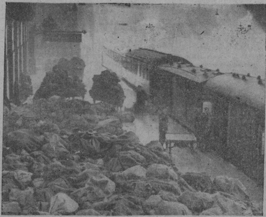
Repetidas veces Londres ha contemplado esta estampa en sus estaciones ferroviarias, aunque la huelga sea ahora una de las más funestas para la nación. Las mercancías se amontonan, los viajeros desesperan y más de doscientos cincuenta mil trabajadores son despedidos en sus empresas, a las que no les llegan las materias primas para seguir trabajando. El Gobierno inglés adopta urgentes medidas, pero la huelga sigue sin esperanza de solución. ¡Y eso ocurre en Inglaterra!

LONDRES, 3 (URGENTE).—CERCA DE 250.000 TRABAJADORES INGLESES HAN RECIBIDO LA ORDEN DE DESPIDO, A CONSECUENCIA DE LA HUELGA DE LOS MAQUINISTAS Y FOGONEROS FERROVIARIOS.—EFE.