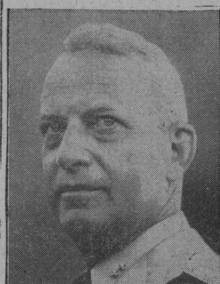
El contraalmirante Arleight Burke, que sucede al almirante Carney como jefe de la Marina de los EE. UU.

Y Martín Artajo un almuerzo en el palacio de Viana