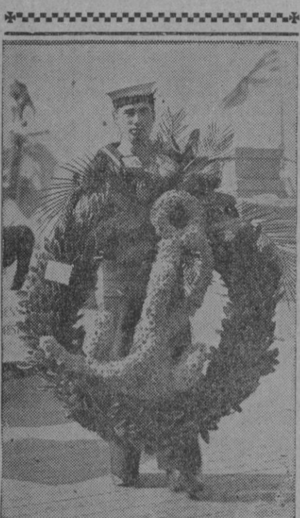
El mar es el más grande cementerio común del mundo. El se ha tragado infinidad de cadáveres. Algunos sobreviven a la tragedia y, como éste, no se olvidan de arrojar a las olas una corona de flores por los compañeros víctimas de su voracidad

Sevilla, 22.—Esta tarde experimentó una agravación en su estado el cardenal arzobispo doctor Segura, administrándole los Santos Sacramentos su capellán, don Santiago Guinea. El arzobispo coadjutor, doctor Bueno Monreal, ha ordenado que en todas las misas que se digan en la archidiócesis se concluya con la oración «pro episcopo infirmo», y ha exhortado a los fieles a que eleven preces por la salud del prelado.