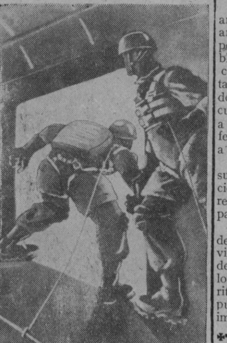
Ha llegado el momento de saltar al espacio, desde el interior del avión. Luego, la caída en el vacío, el abrirse del paracaídas y... ¡pobre del que tenga la desgracia de que el suyo permanezca cerrado!

Palabras del nuncio Por último, el nuncio de Su Santidad pronunció un discurso en el que puso de relieve la importancia de la misión que incumbe a la Acción Católica, tan grata al vicario de Cristo, y agradeció la adhesión de los católicos españoles al Padre Santo.