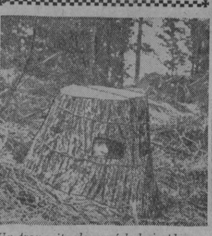
Un tronquito de un árbol simplemente. Pero un tronquito en cuyo interior pueden estar uno o dos hombres y utilizarlo, como aquí, en caso de guerra para puesto de observación

Se dice que Adenauer está muy preocupado por el plan ruso de neutralización, que él cree crearía un vacío de potencia en el centro de Europa.