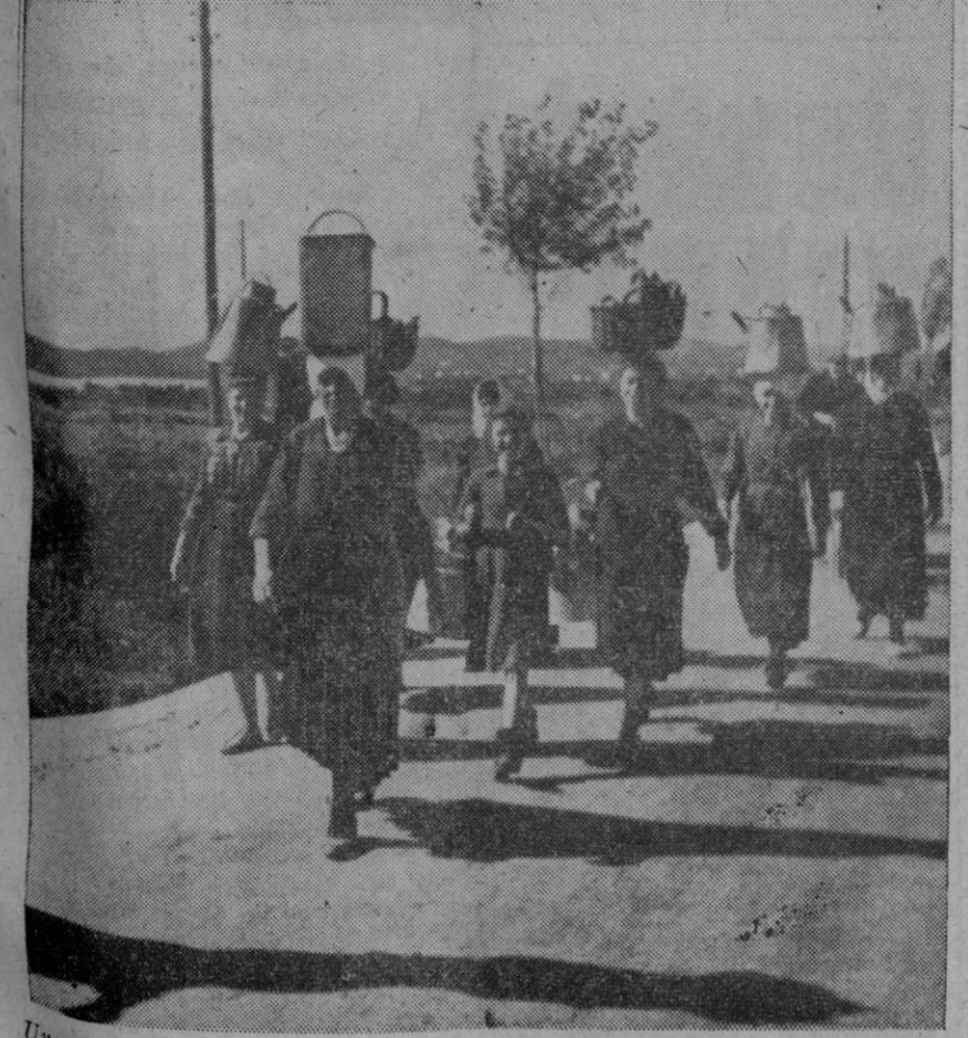
Un grupo de mujeres dálmatas llevando sobre la cabeza sus enseres. Dalmacia es una antigua provincia y reino del fenecido imperio austro-húngaro, en la orilla oriental del mar Adriático. Hoy, la típica región es una provincia más del vasto imperio comunista

Treintá y dos grados fué la máxima temperatura registrada en España, que correspondió a Sevilla, y la mínima de seis grados, a León.—Cifra.