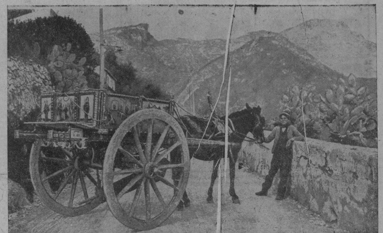
Un joven siciliano descansa junto a su típico carro decorado. Va por el camino retorcido de la montaña, se aproximó un turista, cámara en ristre y le pidió que posara. Y el documento de aquel instante lo tiene el lector a la vista. En su virtud, nos es dada una vista sugestiva de aquélla isla fabulosa y bella, enjorada de sol y llena de hombres violentos, justicieros y duros

Alemania occidental ha ingresado como miembro número 15 de la Organización.—Efe.