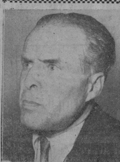
Habib Bourguiba, el jefe exilado del partido de la independencia tunecina, cuya intervención en las negociaciones franco-tunecinas, ha conducido a una feliz conclusión. Túnez ha logrado el derecho de autogobierno dentro del ámbito de la Unión Francesa.

Personas informadas dicen que después de la sesión secreta de ayer, han aumentado las esperanzas occidentales. Dichas sesiones versó sobre delicadas cláusulas económicas. Los delegados se muestran satisfechos de la marcha de las conversaciones.—Efe.