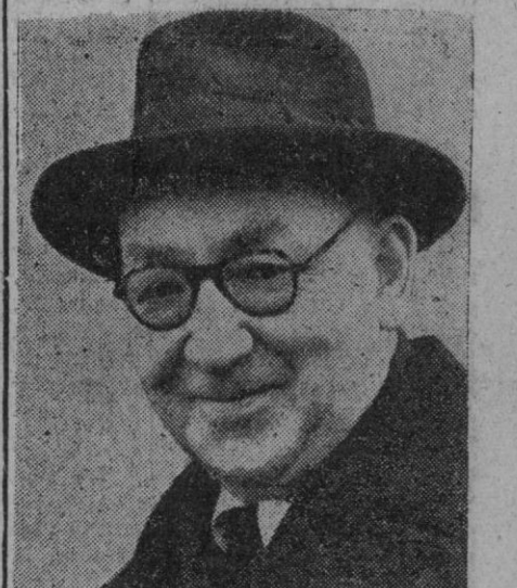
John Cockcroft, jefe del Instituto de Estudios Atómicos de Inglaterra, que ha declarado recientemente, para seguridad de las poblaciones, que la radiactividad que se encuentra en el aire, por ejemplo, después de una explosión atómica, no es peligrosa para los seres vivientes. Sería necesario, dice, que fuera todavía mil veces más fuerte para que ella fuera motivo de inquietud.

Al cierre se tendía a mayor equilibrio en las posturas de la oferta y la demanda.—Cifra.