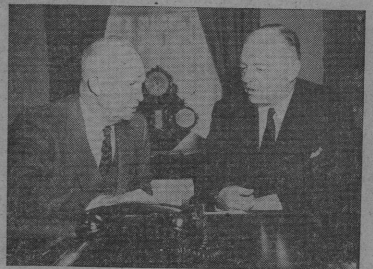
Harold Stassen, nombrado recientemente ayudante especial del presidente Eisenhower en lo relativo a los problemas del desarme, se reúne con el presidente en la Casa Blanca para tratar de los deberes de su nuevo cargo, que le da puesto en el Gabinete norteamericano. Viene a ser en realidad un ministro de la Paz, el primero de su género que haya habido jamás en país alguno