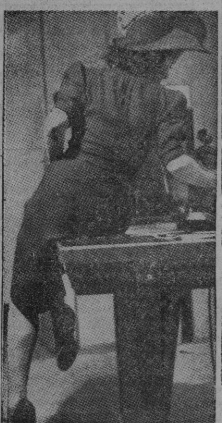
La señorita espera... Y mientras espera, como tiene un aparato de radio junto a ella, se entretiene. Aunque la postura no sea muy cómoda