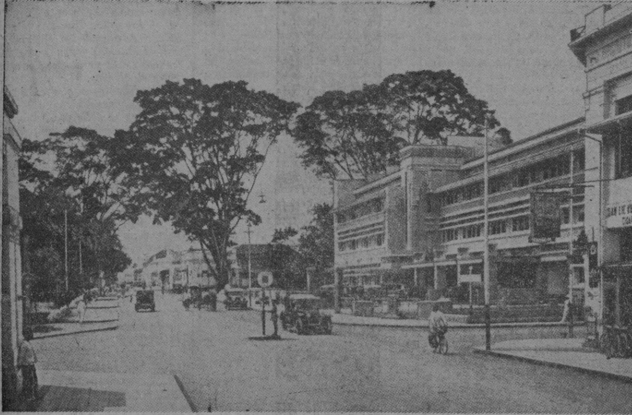
Una de las calles de Bandung, donde actualmente se está celebrando la Conferencia afro-asiática

NEHRU propone la prohibición de las armas atómicas y de sus experimentos