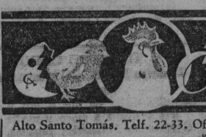
Alto Santo Tomás. Telf. 22-33. Oficinas: José Zorrilla, 113. Telf. 13-90

¿LA MEJOR PERSIANA? No lo dude PERSIANAS HERNANDEZ :: CANTIMPALOS