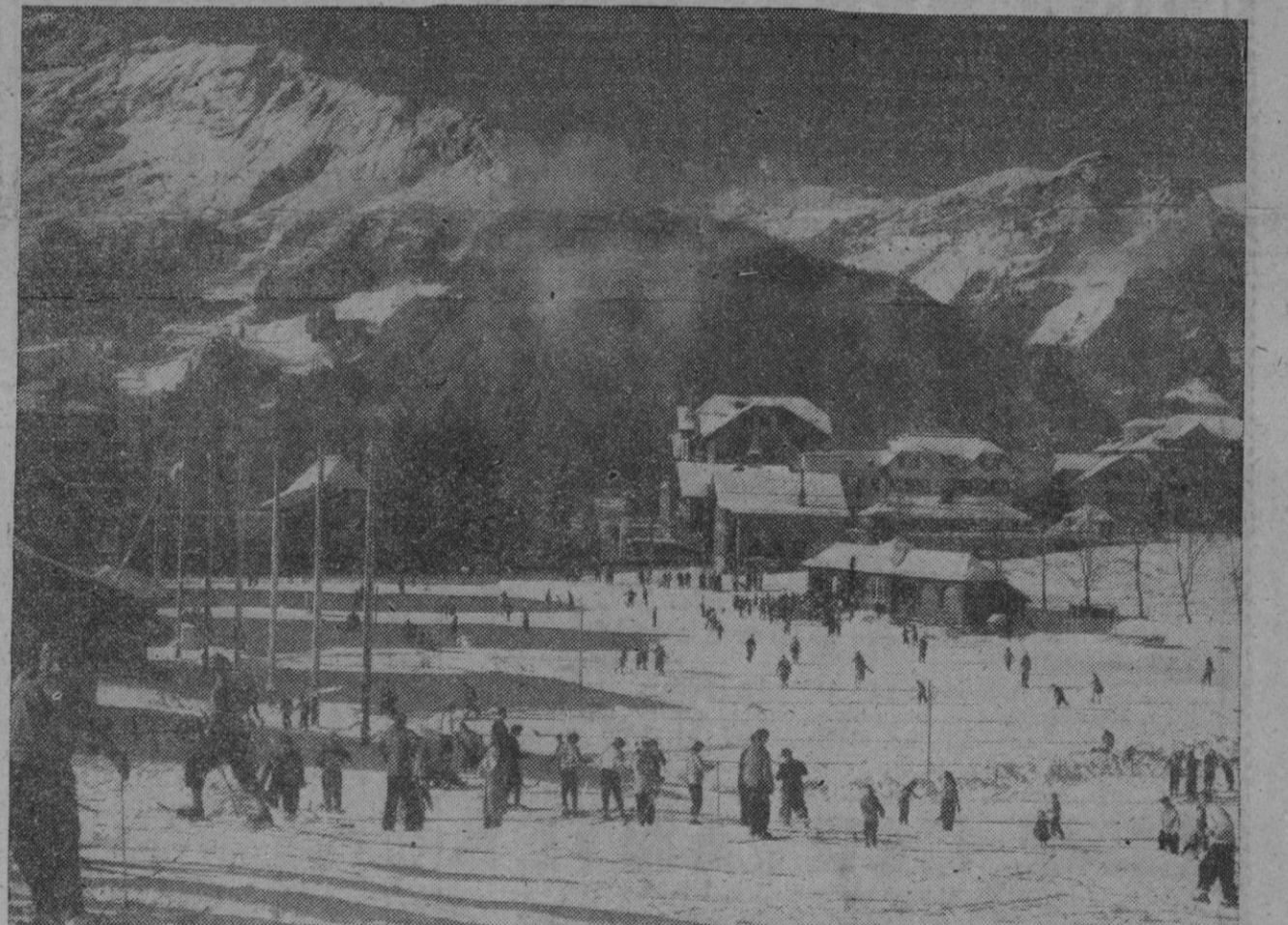
Un bello paraje suizo que, como se ve, está sobradamente concurrido por los amantes del deporte de la nieve. Por nuestra parte, pueden seguir con su "blanco meteo". Nosotros agradecemos a las pruebas atómicas posibles explicación de la muy poca que hasta ahora vemos por nuestras latitudes, esa intervención para que el invierno no haya sido tan crudo, por mucho que pese a los aficionados de por acá. Total, todo se reduce a tomar el tren en busca de otras regiones y así todos tan contentos

La primera provincia en valor de la producción minerosiderúrgica es Asturias con 3.900 millones de pesetas.—Cifra.