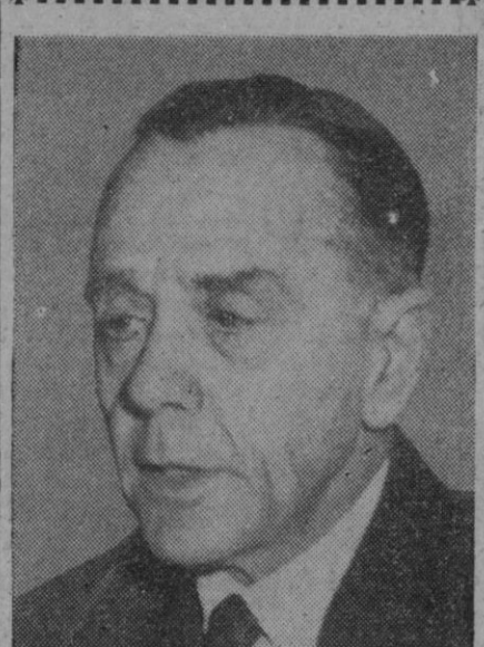
Eric Louw, ministro de Finanzas de Africa del Sur que al mismo tiempo desempeña el puesto de ministro de Asuntos Extranjeros