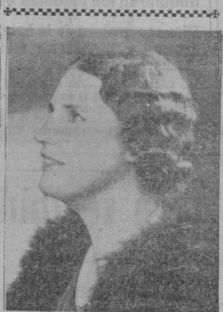
Una figura desconocida para muchos quizás. Una que fué famosa cantante noruega, Kirsten Flagstad, en otros tiempos, hoy ya un tanto lejanos

Madrid, 29.—La Bolsa ha registrado últimamente una clara reacción entre el corro de valores de Petróleos ante el rumor de que los sondeos que se practican en Navarra presentan indicios positivos. La noticia ha de agerse con gran reserva, mientras no la confirmen en los medios interesados, toda vez que las excesivas alegrías pueden desvanecerse más tarde, al no corresponder a la realidad. No es la primera vez que en España se acusan indicios ciertos de la existencia de petróleo, pero nunca se ha llegado a resultados que permitan una explotación de carácter industrial bajo el punto de vista económico.