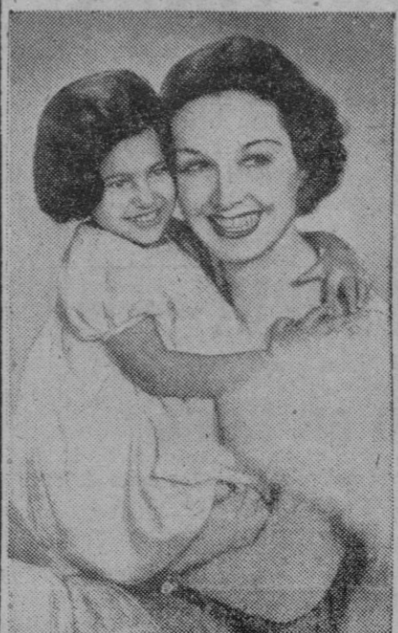
¡Felicidades mamá! ¡Felicidades hija! Pascua, Año Nuevo, y cumpleaños que también los hay en estos días. Por uno u otro motivo las felicidades abundan en estas fechas, y las escenas como ésta o parecidas se repiten por todos los hogares del mundo

En la isla quedaron unos 700 jóvenes, propietarios de tierras que se alerzan a su lugar de nacimiento. «Si este es el fin de nuestra isla, moriremos con ella», dijeron a los funcionarios italianos que trataron de persuadirlos para que se marcharan.—