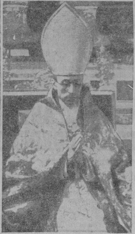
Su Santidad el Papa