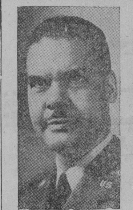
El coronel Benjamin O. Davis, recientemente ascendido por el Presidente Eisenhower a general de la Aviación militar norteamericana, es la primera persona de raza negra que alcanza una graduación tan elevada en ese Cuerpo