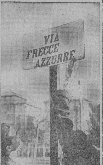
No una mudanza como lo que nosotros entendemos corrientemente por este nombre. ¡Cualquiera deja ahora una casa! Simplemente es la mutación del nombre de las calles. Italia también lo hace. Mañana puede ser que el nombre ya no sirva y hay que buscar otro. ¡La mar de divertido! En esto nos hemos quedado muy atrás de Nueva York por ejemplo: Un número y para siempre: las maldaditas no se casan con nadie

Truman dijo también que no cree que «Rusia» pueda ser conquistada nunca como tampoco lo puede ser Norteamérica.—Efe.