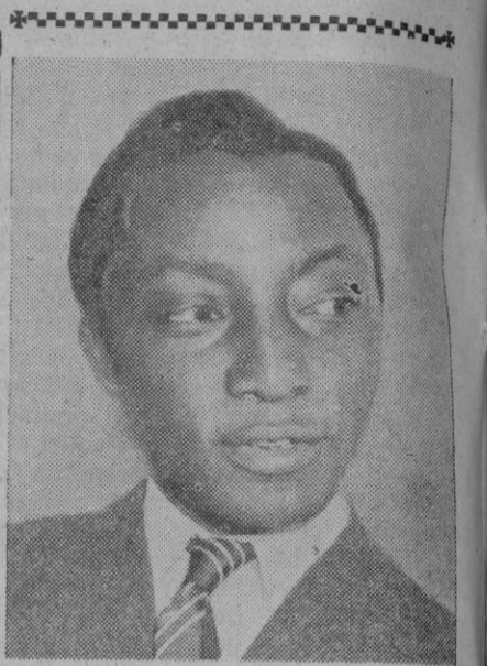
Mutesa II, rey de Buganda, que ha recibido recientemente permiso de las autoridades británicas para volver a su reino, después de un destierro de muchos años en Londres

En una contestación por escrito a nuevas preguntas al respecto y también sobre la visita de una delegación de Gibraltar a Londres, el secretario de Colonias dijo que en los últimos meses se han impuesto por el Gobierno español ciertas restricciones al tráfico normal de mercancías y personas con Gibraltar.—Efe.