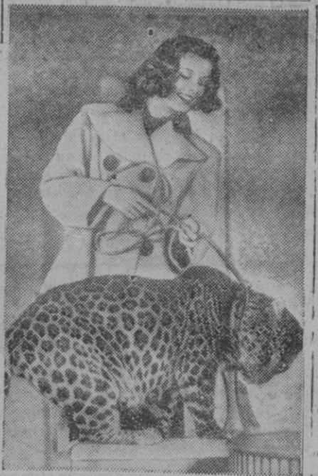
¡Pobre bicho! Domesticadito y todo, y acariciado por los mimos de Katharine Hepburn, y aun paseando por las calles de Hollywood, nos suponemos que a estas horas ya habrá gastado su piel para cubrir la suya la famosa artista

Los Estados Unidos—dice la United Press—han dicho claramente que ayudarán a defender Formosa, pero su política en relación con algunas de las islas a la altura de la costa, no ha sido nunca aclarada.—Efe.