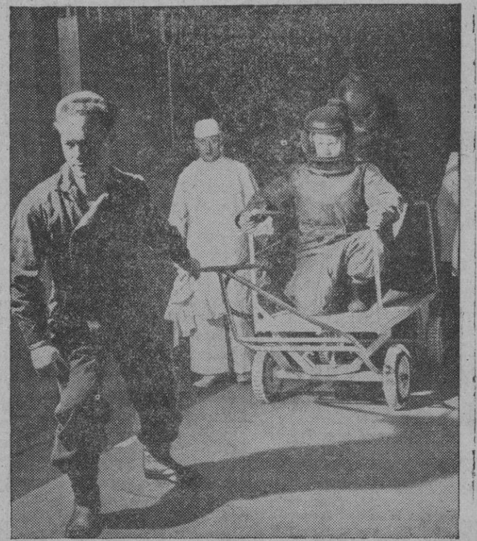
En las instalaciones de energía atómica, los trabajadores son trasladados de una dependencia a otra con toda clase de precauciones, para evitar posibles contaminaciones del polvo radiactivo que pudiera haberse adherido a sus ropas protectoras