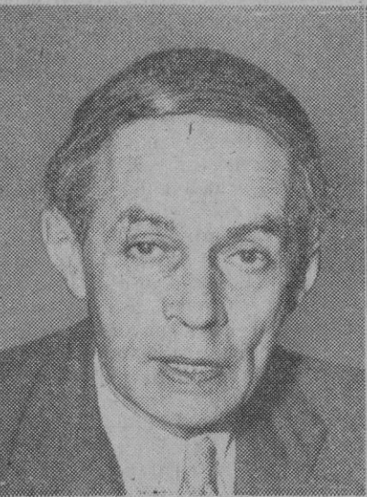
Ernst Friedländer, nuevo presidente de la Unión Europea, en Alemania

Túnez, 11 (4 t.).—Cinco soldados franceses han sido raptados por «fellagah» cerca de Siliana, a cien kilómetros al oeste de Túnez, según se declara de fuente competente. Fueron capturados por los «fellagah» anoche durante una incursión por sorpresa sobre un pequeño puesto de guardia en un bosque.—Efe.