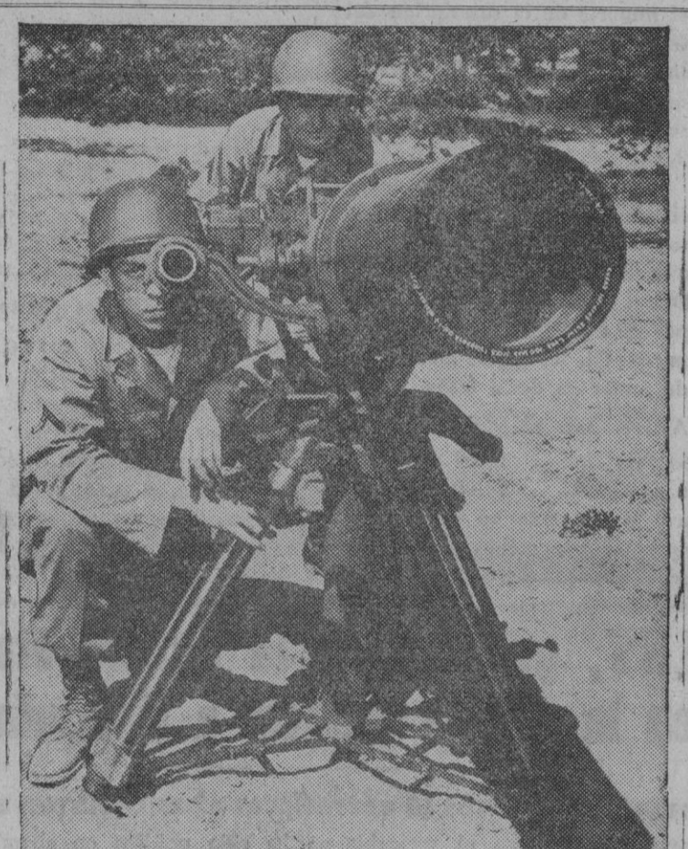
Esta es la nueva cámara fotográfica del Cuerpo de Transmisiones del Ejército norteamericano, provista de una lente de 254 cms., para fotografías a larga distancia. Esa cámara penetra a través de la niebla y recoge en su campo de visión detalles con finura suficiente hasta a una distancia de 50 kilómetros, o sea, aproximadamente, la que separa Madrid de El Escorial. Para su funcionamiento se necesitan dos personas

«Escuela de Hogar», no es una publicación femenina más, es el mejor aliado del ama de casa en el que encontrarás cada tres meses, recetas, labores, modas y trabajos manuales