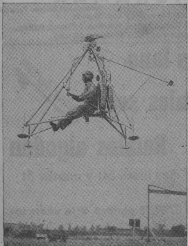
El primer helicóptero de propulsión a chorro de la Marina norteamericana, el RH-1, se eleva en el aire en unas pruebas efectuadas en la base aérea de la Marina de Los Alamitos (California). Se ha tardado cerca de cuatro años en diseñar este monoplaza. Sus características le hacen recomendable para las operaciones de reconocimiento y observación. Una de las novedades de este helicóptero es el control del motor por medio de una válvula. Los modelos anteriores sólo disponen de encendido y apagado.

Madrid, 27.—El ministerio de Educación Nacional distribuye un crédito de 273.000 pesetas, incluidos gastos de calefacción y luz, a las bibliotecas de varias capitales y ciudades españolas, correspondiendo a la de Segovia la cantidad de 4.000 pesetas.