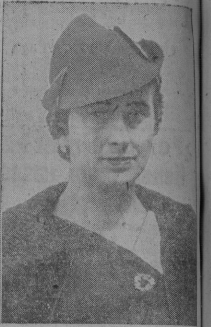
La esposa de S. E. el Jefe del Estado, doña Carmen Polo de Franco, quien al celebrar hoy su fiesta onomástica deseamos toda clase de venturas.