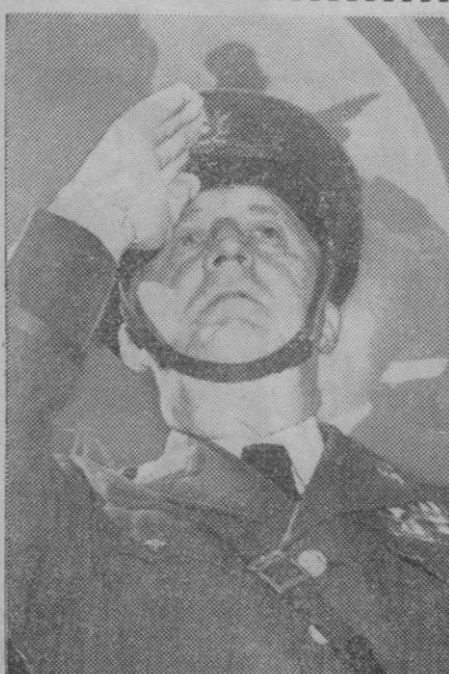
Este militar se ha puesto muy serio mientras su vista parece escaparse hacia las nubes y su mano derecha parece que va a iniciar el "Por la señal..." un tanto descentrado. Pero nada de eso; él es un oficial de los Estados Unidos que saluda a la bandera de su nación

Han sido saqueados y destruidos conventos y claustros y han sido disueltas congregaciones religiosas. Están prohibidas las procesiones de carácter religioso y las reuniones católicas. Se ha prohibido la instrucción religiosa en las escuelas. Se permite ir a la iglesia pero aún esto resulta peligroso para empleados públicos y para los militares, que se verían destituidos de sus cargos y castigados sólo por haber cumplido con sus deberes religiosos. La mayor parte de las iglesias de la zona B han quedado disueltas, dado que los respectivos párrocos, fieles a su obispo, han sido alejados de sus centros contra su propia voluntad.—Efe.