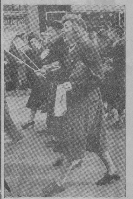
En Nueva York se explican muchas cosas que aquí consideraríamos irracionales o inútiles para cualquier empresa o propósito. Allí lo más mínimo es ya un buen pretexto para manifestarse los hombres, las mujeres o todos juntos. Ahora va de señoras. No sabemos por qué, pero ellas protestan. Y nos figuramos que llevarán razón. Habrán subido los ajos...

El alto mando francés no publica cifras de bajas, pero dice que la lucha cuerpo a cuerpo comenzó a última hora de anoche.—Efe.