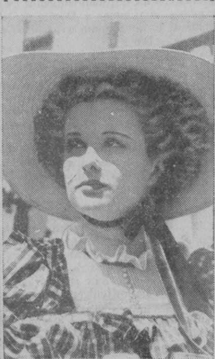
Sufrir algún accidente durante el rodaje de una película le ocurre a cualquier artista de cine. Por eso no es de extrañar que Joan Bennett lo sufriera también alguna vez. Ahí está en su mejilla derecha la "caricia" de una bayoneta durante las escenas de un film y, desde luego, cuando era más jovencita.

Cuenca, 8.—Más de mil zorras lleva cazadas, aparte de otro gran número de tejones y otros animales. Manuel Hoyos Fernández. Para ello usa un procedimiento original, cuyo que se niega a revelar, mediante un compuesto químico fabricado por él mismo, después de haber estudiado por autopsias en los animales caza-