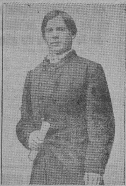
Este es Ricardo Nordraak, compositor noruego que se hizo célebre a pesar de haber muerto a los veinticuatro años de edad. Es conocido sobre todo porque fué el creador del himno nacional noruego que fué cantado por primera vez el 17 de Mayo de 1864 por un pequeño grupo de estudiantes

LOS EJERCICIOS DE SAN IGNACIO HAN APARTADO A MUCHOS HOMBRES DEL CAMINO DEL MAL. CABALLERO: ASISTE A LA TANDA QUE COMIENZA EL DIA 15 EN LA IGLESIA DE SAN MIGUEL