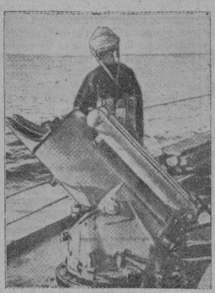
Un arma mortífera para los submarinos es la bomba de grandes profundidades. En la pasada guerra, estas bombas prestaron grandes servicios por su eficacia. Aquí tenemos, a bordo de un barco, el aparato lanza bombas, dispuesto a entrar en acción al menor indicio de aparición del submarino enemigo que el centinela parece querer escudriñar a través de las aguas del Océano