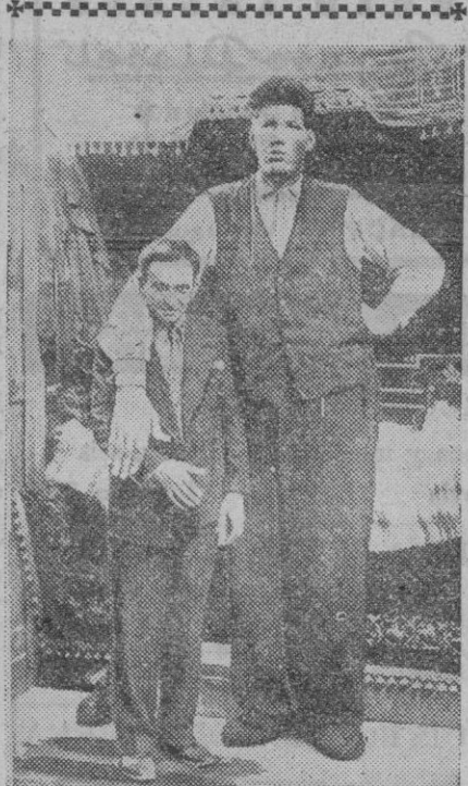
Aunque ustedes no lo crean —pero imaginamos que sí lo creerán nada más ver la fotografía— este angelito mide dos metros treinta centímetros de estatura y pesa ciento cuarenta kilogramos. Claro que esto de los kilos no tienen nada que ver si les comparamos con los que pesa esa pequeña de nueve años que ha sido la sorpresa de la pasada semana. Porque, después de todo, el muchacho éste se dedica al boxeo y aquella a "sus labores".

El orden del día de la Conferencia quedó establecido en tres puntos: formación del profesorado de Segunda Enseñanza; situación económica, social y moral del Magisterio de Segunda Enseñanza, y redacción del correspondiente Estatuto, y, en tercer lugar, examen de los informes redactados por los Ministerios de Educación, en los que se dará cuenta del movimiento escolar 1953-1954.—Efe.