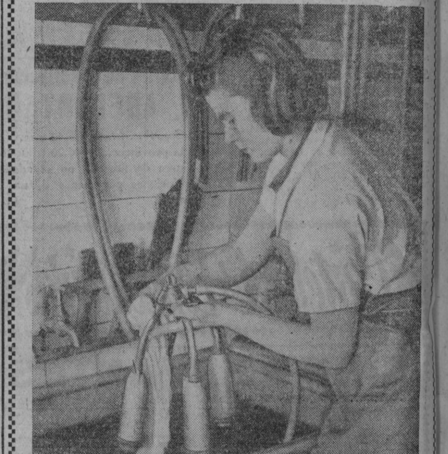
Indudablemente que la cosa es de interés para los granjeros. Los aparatos que se muestran en la fotografía y que la joven está lavando después de su uso, son eléctricos y permiten obtener diariamente 190 galones de leche en una granja de Inglaterra. Claro que igual podría conseguirse aquí de utilizarlos ¿no es verdad?