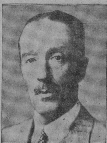
El duque de Alba

Hizo sus estudios en Inglaterra y en la Universidad Central de Madrid, en donde terminó la carrera de Derecho. Desde muy joven empezó a recorrer el mundo y visitó todos los países de Europa, gran parte de los de América del Norte, África y Asia. Cultivó las letras y tiene una serie de obras publicadas de singular valor. Figuran entre ellas la «Correspondencia de Gutiérrez Gómez de Fuensalida, embajador de Alemania, Flandes e Inglaterra», «Noticias históricas y genealógicas de los Estados de Montijo y Teba», según los documentos de sus archivos; «Contribución al estudio de la persona del tercer duque de Alba» y «El mariscal de Berwick, Bosquejo biográfico».