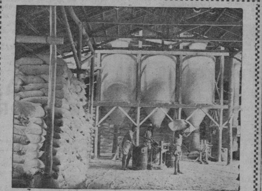
Estos montones de sacos y los tres grandes depósitos, pertenecen a un almacén de tierra diatomácea, que es un agente multicelular y aislante que se emplea para la fabricación de ladrillos y losas. Antes de la guerra, Inglaterra importaba este producto de los Estados Unidos, pero en la actualidad, lo obtiene de los lagos secos en Kenya.

Madrid, 24.—La Dirección General de Seguridad ha facilitado una nota en la que dice que la autoridad gubernativa, a la vista del informe del presidente de la corrida que iba a celebrarse esta tarde, después del reconocimiento realizado por los señores veterinarios a las diez horas de esta mañana, ha acordado suspender la corrida por falta del peso reglamentario de cuatro de las reses que habían de lidiarse. Para esta corrida, a beneficio del Montepío de Toreros, estaba anunciada la actuación del rejoneador Angel Peralta y de los diestros Julio Aparicio y Jumillano, mano a mano.—Cifra.