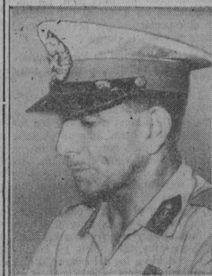
El general Naguib, jefe del Gobierno egipcio

Seguidamente, el señor Iturmendi declaró inaugurado el año judicial.—Cifra.