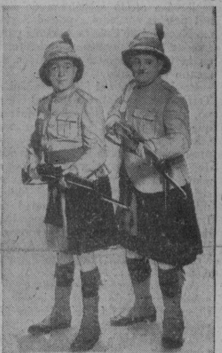
He aquí a dos figuras involuables del cine, el «gordo» y el «flaco»—en traducción literal Stan Laurel y Oliver Harley—en una fotografía hecha cuando el flaco era flaco de verdad y cuando el gordo aún no lo era del todo. Hoy de ellos sólo queda ya el recuerdo y alguna película vieja que se proyecta como complemento. ¡Y antes eran base de programa!

El señor Moreno Fernández fué cumplimentado durante su breve estancia por el ayudante militar de Marina de la zona, a quien el ministro expresó su sentir de no disponer de algunas horas libres para examinar la transformación que sufre la zona marítima-terrestre de la ría de Avilés con motivo del establecimiento de factorías industriales.—Cifra.