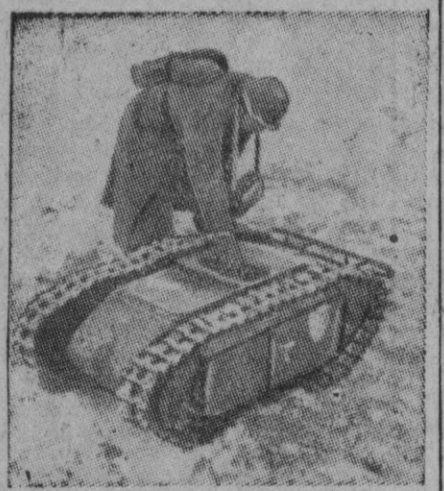
Casi no dan ganas de hablar de armas, ahora que parece que por una temporada se van a terminar las guerras, pero... se trata simplemente de una foto histórica de la 2-G. M.

Por las principales calles de Figueras puede verse a casi todas las horas del día una mezcla de tipos que hablan diferentes lenguas y lucen la más variada indumentaria, y en los hoteles se hace difícil poder encontrar una habitación libre. Algo parecido sucede en las poblaciones veraniegas de la Costa Brava, tales como Rosas, Cadaqués, etc., donde la afluencia de extranjeros es también inusitada.—Cifra.