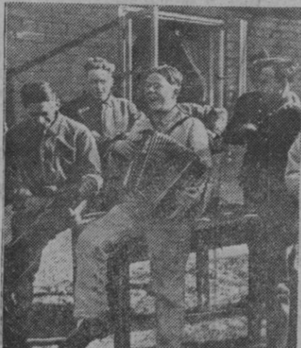
¡Música, maestro! Y el acordeón comienza a desgranar melodías con su voz gangosa, dulce, recreándose en cada nota que deja escapar. Y a su alrededor, un coro improvisado de muchachos que se disponen a distraer un rato de ocio entonando una canción popular. Y así, la vida, amigos, entre sudor y alegría, se hace más llevadera.