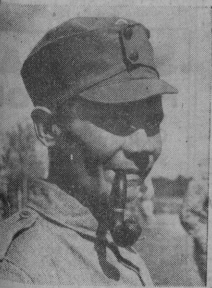
He aquí un típico soldado finlandés, como otros muchos que podrían presentarse. Es seguro, confiado, tranquilo, de sangre fría. Muchas veces ha visto este hombre la muerte delante de sus ojos, pero en su mirada hay una extraña y fortísima seguridad en sí mismo. Mientras no le falte el "teig", su tabaco preferido, apretado en su cachimba, él está contento.

Procedente de Canadá ha llegado el día 7 del actual, al puerto de Valencia, el vapor «Eolo», transportando un cargamento de 7.293 toneladas de trigo con destino al abastecimiento de Valencia y Castellón. Asimismo, procedente de Canadá, ha llegado en el día de hoy, al puerto de Bilbao, el vapor «Monte Serantes», transportando un cargamento de 1.072 toneladas de trigo para el abastecimiento de Zaragoza, Huesca y Gerona.