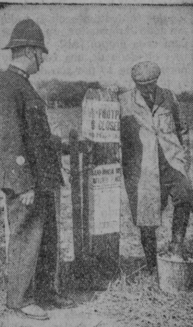
Bajo la implacable vigilancia del guardia, un ciudadano se ve obligado a meter sus pies en un cubo conteniendo un enérgico desinfectante.