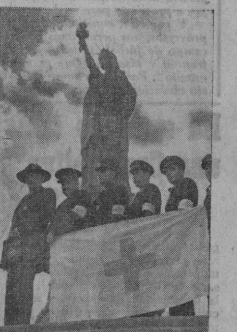
Delante de la celeberrima estatua de la Libertad que saluda al viajero en la boca del puerto de Nueva York, con la mítica antorcha levantada hacia las nubes, se retratan los guías que están al servicio de los turistas para enseñar a éstos las instalaciones colocadas en el interior de la colosal figura.

En Ismailia todos los vehículos son detenidos y registrados