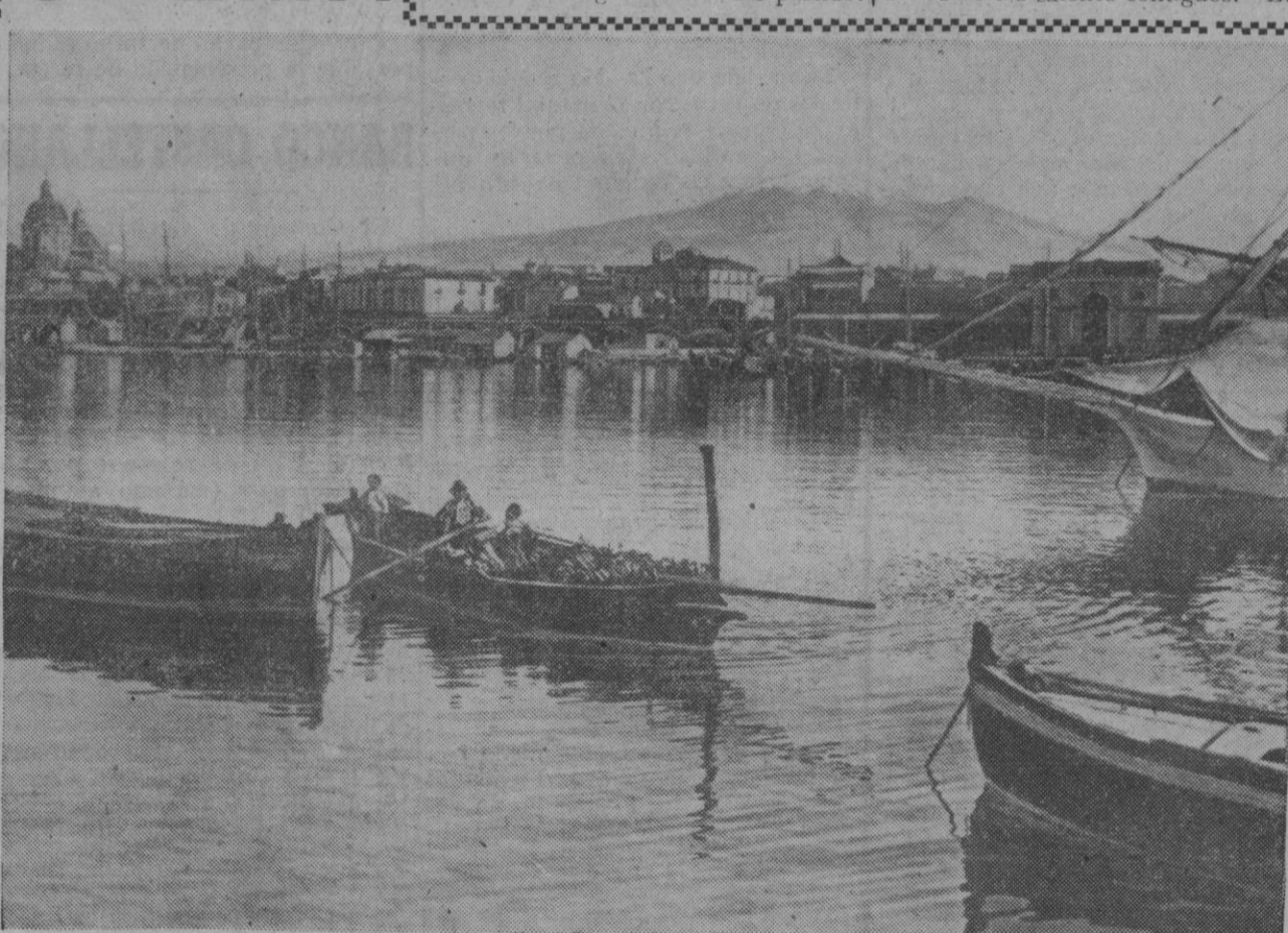
Sicilia es una de las partes del mundo más bella. La dulce calma que en ella se nota siempre y la maravilla de sus paisajes, hacen de esta isla un lugar preferido para el descanso.