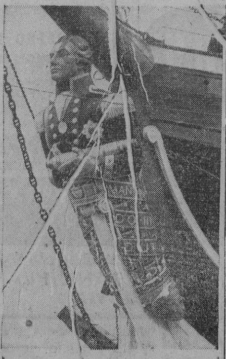
La proa de un barco es lo que ustedes tienen a la vista. El barco es el buque escuela inglés, que cruza los mares precedido del almirante Nelson, que es a quien representa la figura.