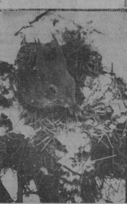
La ardilla es tenida, seguramente con razón, por uno de los animales más listos, hasta el extremo de compararla a los hombres que gozan de la misma fama. Aquí tenemos a uno de estos animalitos en su nido, aguantando la nevada, con la expresión tan viva como siempre.