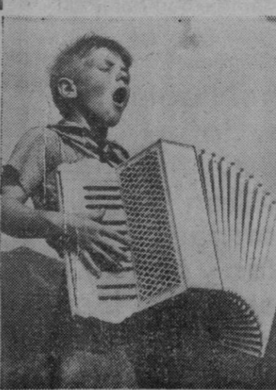
Un pequeño tirolés que, no obstante sus pocos años, maneja este gran acordeón como un hombre hecho y derecho, y, además, canta y gargantea con el más puro arte tirolés.