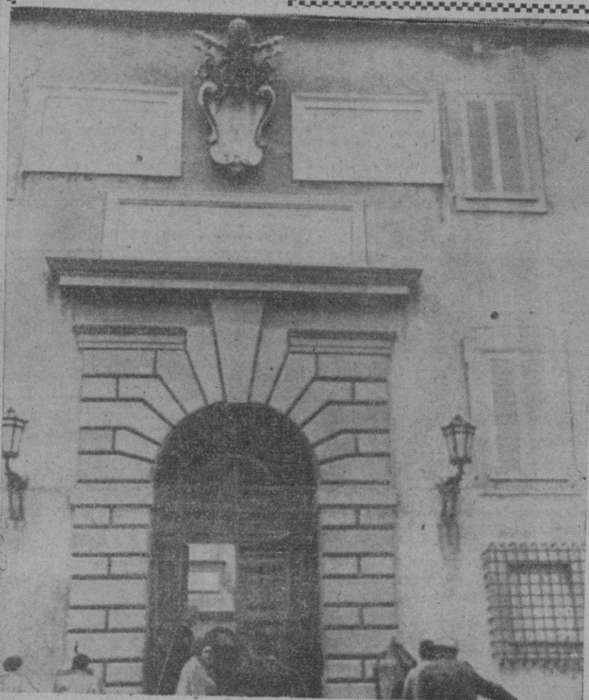
Por esta puerta sale la fe que alienta al mundo. Se trata de la puerta principal del Vaticano, que en estos días presencia los azares de una de las ceremonias más esplendorosas de la Iglesia católica, con ocasión de haber convocado Consistorio Su Santidad para completar el Sacro Colegio Cardenalicio.

que le juran de rodillas obediencia y lealtad, y este mismo juramento lo hago yo a Su Santidad. Mi emoción sube de punto al considerar las personas que en este momento me acompañan y que durante más de quince años han trabajado junto a mí, consagradas al bien de la Iglesia. También recuerdo en este momento a España, que quedará siempre impresa en mi corazón. En ella empecé mi carrera diplomática, que hoy termina, y todo lo que acaba atañe directamente a los sentimientos de nuestro corazón. Estoy especialmente conmovido y pido a todos una oración para que Dios me ilumine en las nuevas responsabilidades que me esperan. Gracias de todo corazón a todos.»