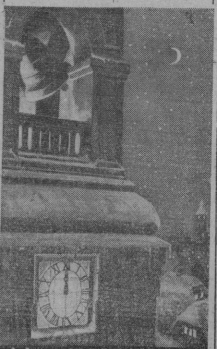
No se puede pedir más de una «foto» para representar, como símbolo, las noches de invierno. La nieve y la hora exacta en que termina un día y comienza otro harán que el lector se sienta más a gusto sentado alrededor de la «camilla».