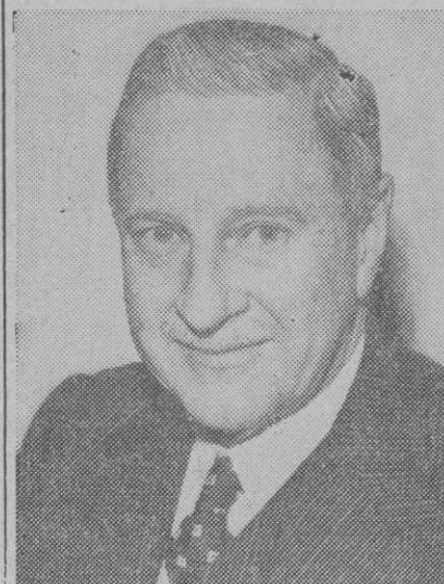
M. Winthrop W. Aldrich, embajador de Estados Unidos en Inglaterra

El primer ministro británico realizará el viaje a bordo del trasatlántico «Queen Mary», y pasará unos quince días en la colonia británica de Jamaica, después de su breve visita a los Estados Unidos.