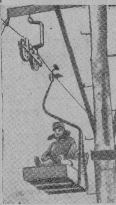
Este tren aéreo comunica dos montañas, quinientos kilómetros al norte del círculo Polar, junto al mar de hielo. Gracias a este ingenioso y peligroso aparato no permanecerán aislados los pequeños pueblos y refugios de las laderas de las montañas.