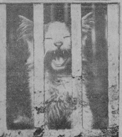
Esta vez la jaula no encierra una fiera terrible, ni mucho menos. Se trata sólo de un gatillo, que al verse encerrado llora, pidiendo clemencia, para que le pongan en libertad.