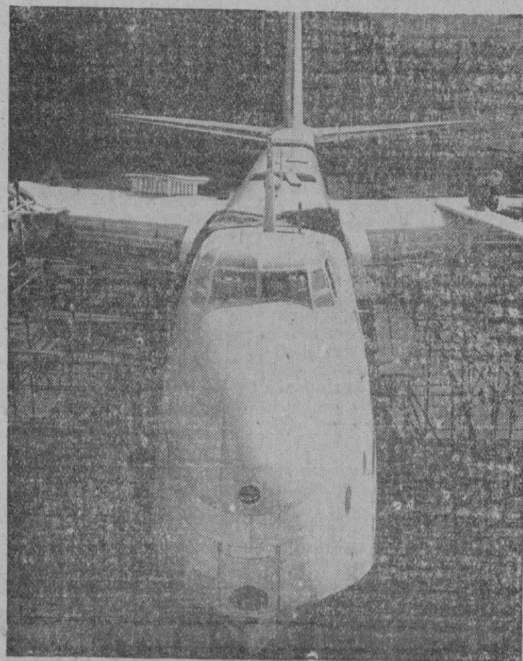
Este impresionante aparato, que aún no está terminado, es de gran potencia y han de tripularlo once pasajeros. Se dedicará al transporte aéreo y en él podrán viajar setenta personas.