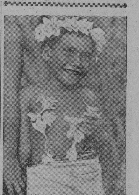
En Tahit6, las fiestas tienen todo el sabor tropical y atrayente que hemos visto en el cine.

Teher6n, 4.—Cinco personas han resultado muertas y otras diez heridas, seg6n informaciones de prensa, al disparar la polic6a para hacer cesar la lucha entre manifestantes comunistas y anticomunistas, promovida en la ciudad de Senam al lanzarse grupos partidarios del Gobierno a desalojar a los del Tudeh de una f6brica que ocupaban.