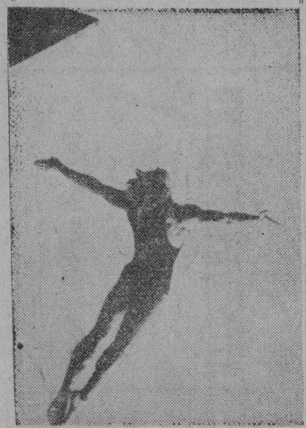
El agua no se ve, pero nuestro instinto de conservación nos hace suponer que estará debajo, esperando a esta bañista. Porque a pesar de su formación atlética, se trata de una señorita.