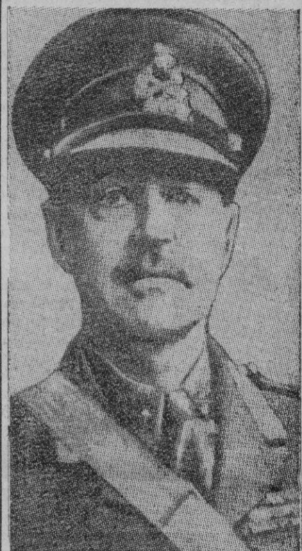
El vizconde Alexander

Londres, 27.—El mariscal vizconde Alexander ha sido nombrado ministro de Defensa del Reino Unido. Desempeñaba la cartera desde que formó Gobierno, el «premier» Churchill. En el cargo de gobernador general de Canadá sustituirá a Viscount Massey al mariscal Alexander.—Efe.